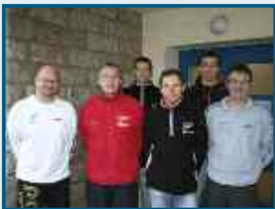
Les éducateurs sportifs