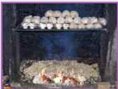
Exposition Le Sabot, Médiathèque juillet 2013