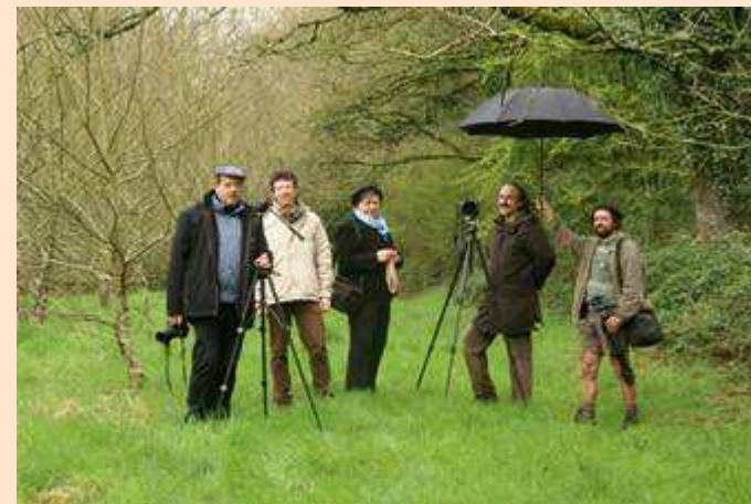
L'atelier photographique 29 mars 2008