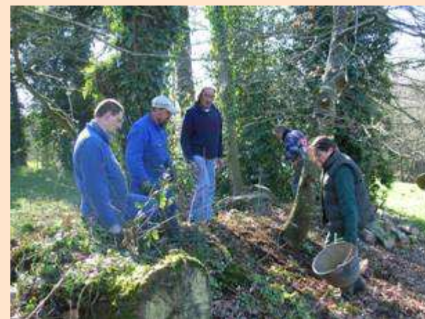
Regarnissage de talus, université bocagère du 5 mars 2008