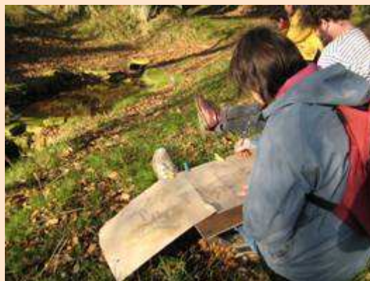
L'atelier croquis de randonnée 9 février 2008