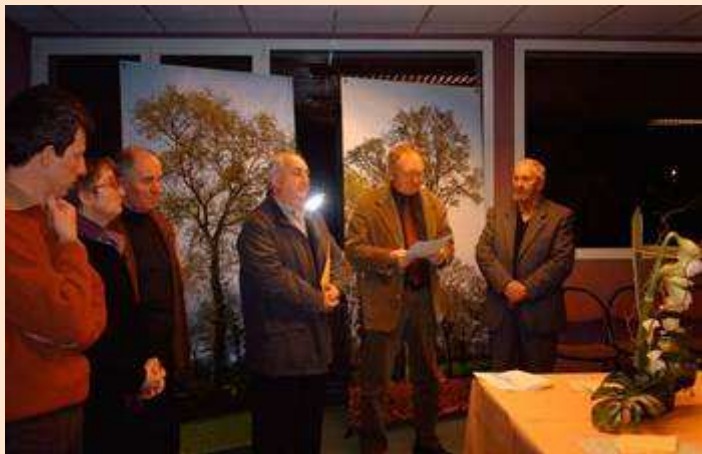
Inauguration de l'exposition « L'arbre, la haie, les hommes » à Merdrignac le 4 février 2008